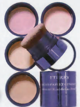
Light Expert Compact By Terry, 42 €.