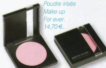
Poudre irisée Make up For ever, 14,70 €.