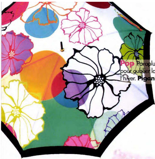
Pop Parapluie très coloré pour oublier la grisaille de l'hiver. Piganiol , 85 €.