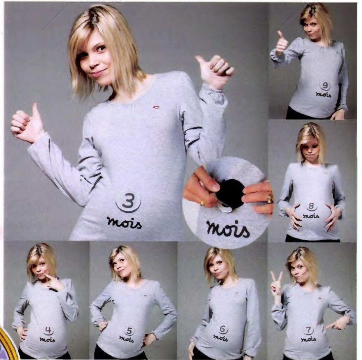
Scratché T-shirt « 9 mois » doté de plusieurs Velcro interchangeable qui permettent d'indiquer clairement l'avancée de votre grossesse. MammaFashion , 39 €.