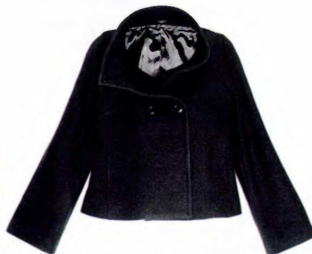
Marin Caban en laine mélangée. Benetton , 86,90 €.