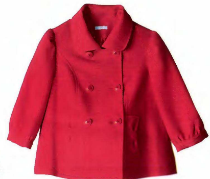
Chic Paletot petit prix. Eurodif , 34,99 €.

Tous nos modèles en page Les adresses de famili