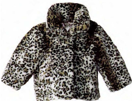
Félin Fourrure acrylique « Léopard ». Bon Prix , 49,90 €.