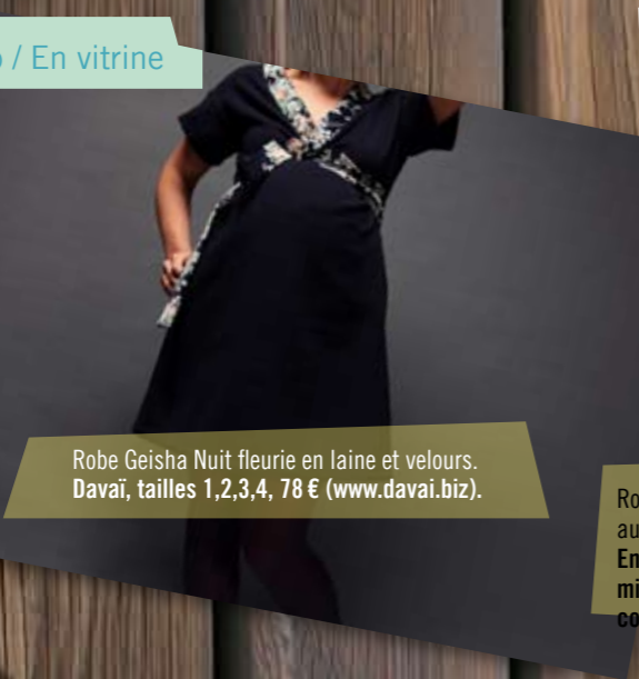
Robe Geisha Nuit fleurie en laine et velours. Davai, tailles 1,2,3,4, 78 € ( www.davai.biz ).