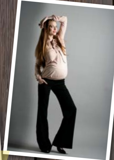
Pantalon Drew en crêpe avec bandeau de jersey, et top Tatiana poudre en jersey modal fluide. Pomkin, du XS au XL, 98 € et 65 € ( www.pomkin.com ).