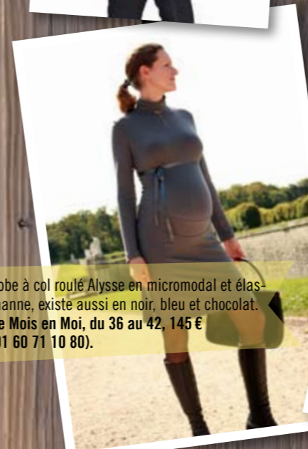
Robe à col roulé Alysse en micromodal et élasthanne, existe aussi en noir, bleu et chocolat. De Mois en Moi, du 36 au 42, 145 € (01 60 71 10 80).