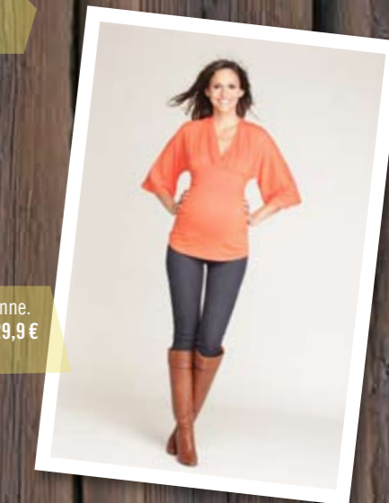
Top Ania, 90 % viscose et 10 % élasthanne. Envie de Fraises, du 36/38 au 44/46, 29,9 € ( www.enviedefraises.fr ).