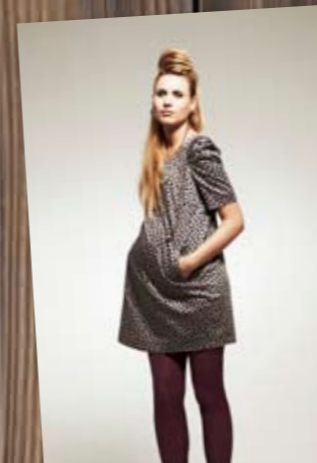
Robe habillée avec épaulettes Skara, 98 % coton, 2 % élasthanne et doublure polyamide. Bellybutton, du 36 au 42, 139 €, ( www.emoi-emoi.com )