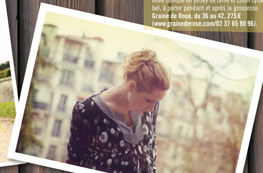
Robe tunique en jersey de laine et coton Lysabel, à porter pendant et après la grossesse. Graine de Rose, du 36 au 42, 275 € ( www.grainederose.com/02 37 65 90 96 ).