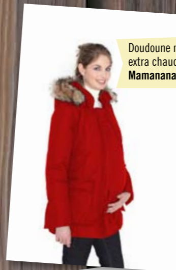
Doudoune maternité et portage en vrai duvet d'oie extra chaud, existe en noir, chocolat et kakhi. Mamana, du XS au XL, 400 € ( www.mamana.com )