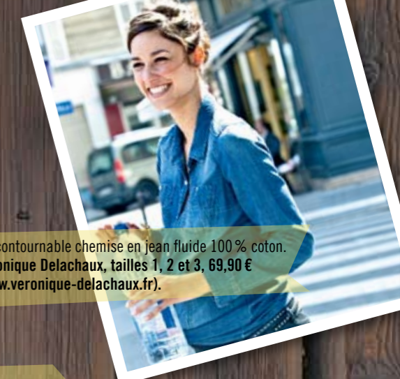
L'incontournable chemise en jean fluide 100 % coton. Véronique Delachaux, tailles 1, 2 et 3, 69,90 € ( www.veronique-delachaux.fr ).